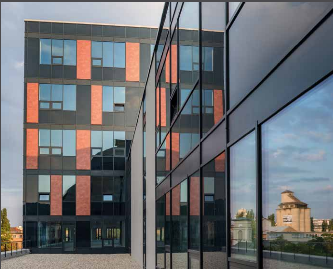
Stein 2 Office, Slovakia | Material: ALUCOBOND® PLUS vintage Coracero | Architect: Ateliér Ivan Kubík | Fabricator: ALUSTEEL | © Martin Viazanko