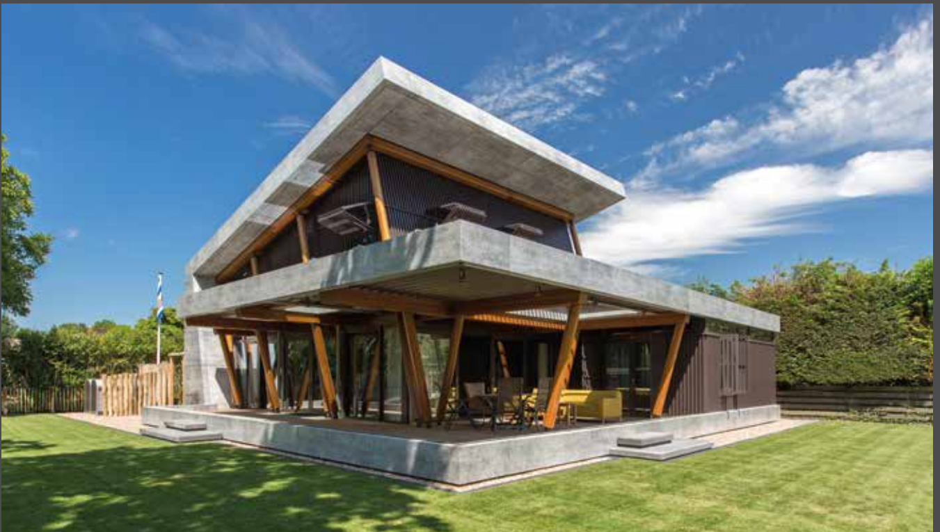
Holiday Home, the Netherlands | Material: ALUCOBOND® PLUS vintage Rough Concrete | Architect: Architekenburo TEN HOVE B.V. | Fabricator: MZAllpro | Installer: Cladding Partners B.V.